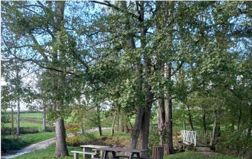
Crédit photo : Aire de pique-nique du Passage à Gué (mairie Urbise)