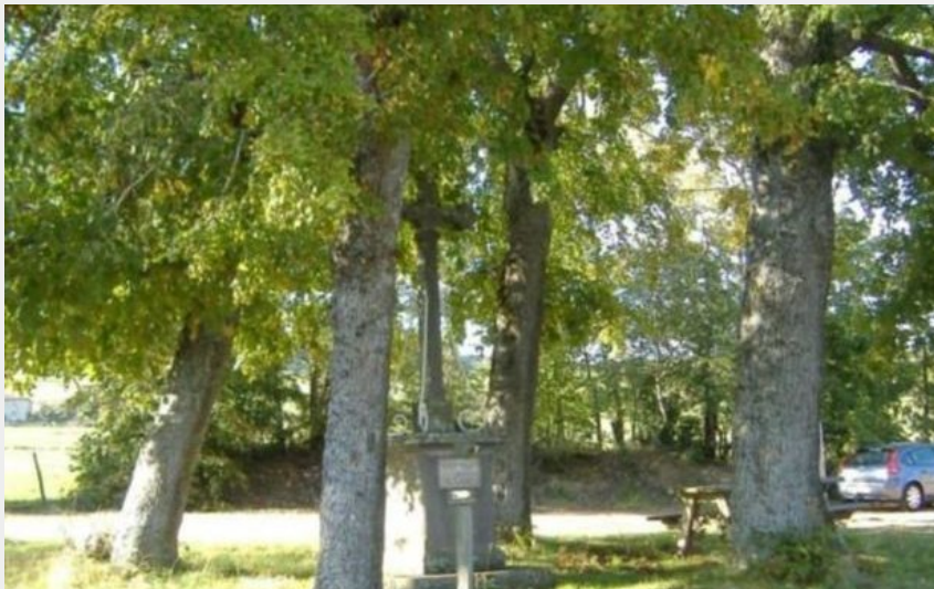
Aire de pique-nique les 4 tilleuls, cherier