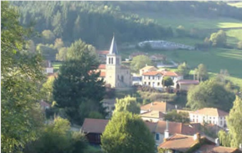
aire de pique-nique de la mairie des Moulins, Cherier