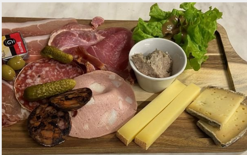
Crédit photo : Planche de charcuterie (Restaurant du Hameau des Eaux d'Orelle)