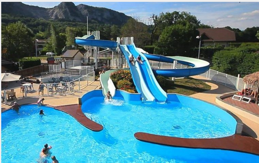
piscine extérieure avec toboggan