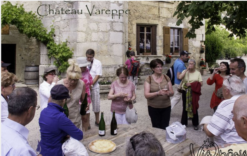
Crédit : Dégustations à l'occasion de ViaRhôna en fête (©Bernard Vivier)