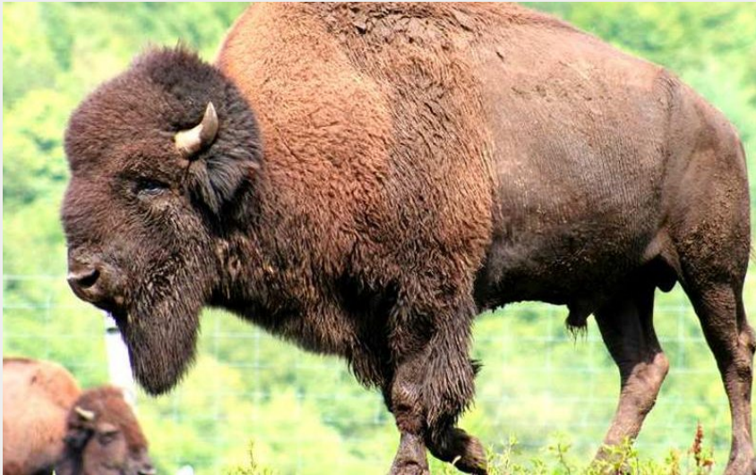
Crédit photo : Bisons des Monts de la Madeleine (Mme Nicole Mouiller)