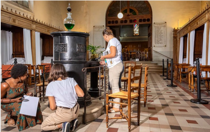
Crédit photo : Hôtel Dieu de Belleville (Etienne Ramousse Destination Beaujolais)