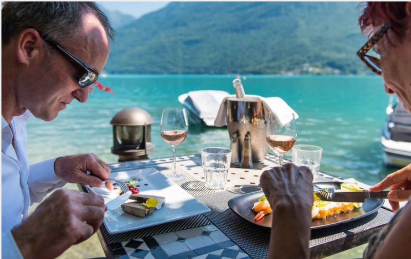
Crédit : Doussard restaurant Chez ma cousine (T. Nalet/Sources du lac d'Annecy)