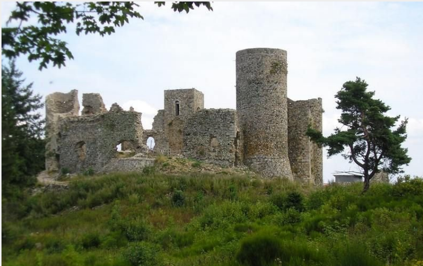
Aire de pique-nique château dit des Cornes d'Urfé Champoly