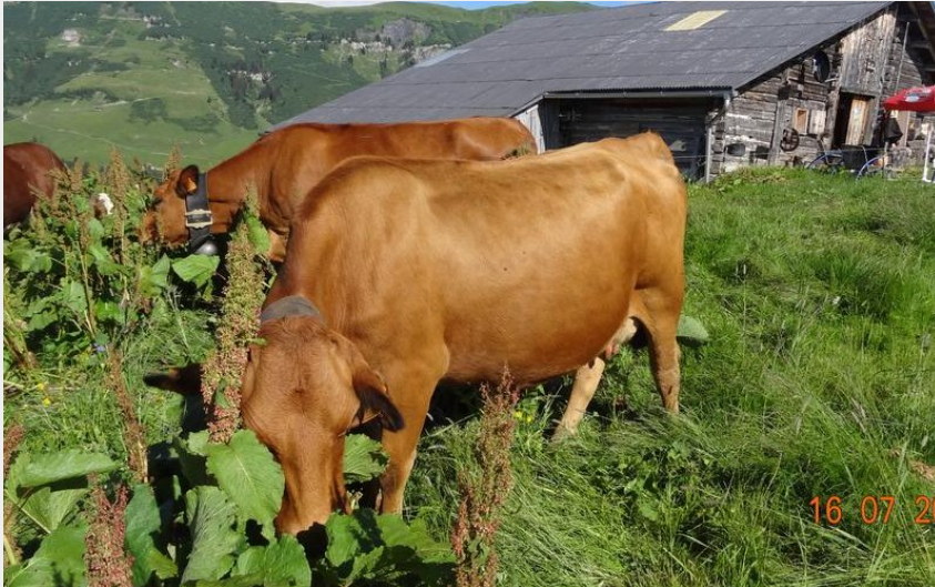
Crédit : Goûter au chalet du Cuvy - Arêches-Beaufort