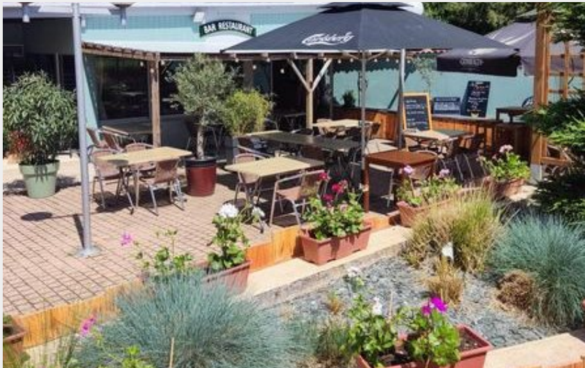
Crédit : Terrasse coté bar