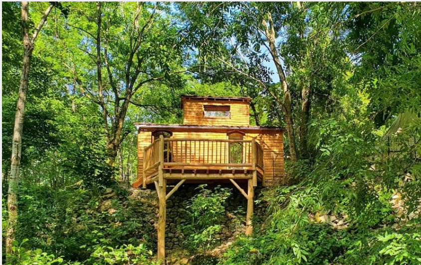
Crédit : Mayres - camping auprès de mon arbre - cabane (©campingaupresdemonarbre)