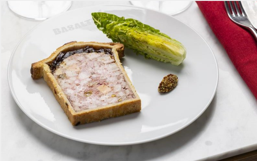
Crédit : Pâté en croute maison, foie gras et champignons (Aurelio RODRIGUEZ)