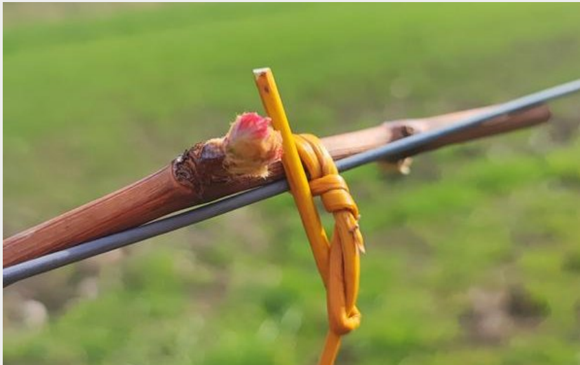
Crédit : Attachage traditionnel à l'osier