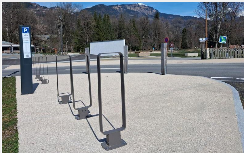
Crédit : Vue sur les attaches vélos (Cyril Noel/Mairie de Morillon)