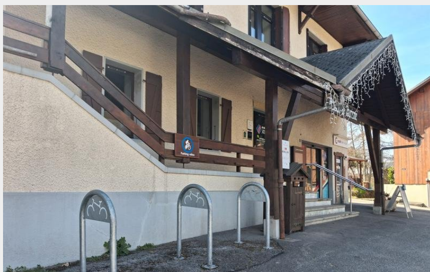
Crédit : Vue sur les attaches vélos (Cyril Noel/Mairie de Morillon)