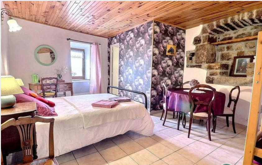
La chambre familiale 1 lit en 140 et 1 lit en 90