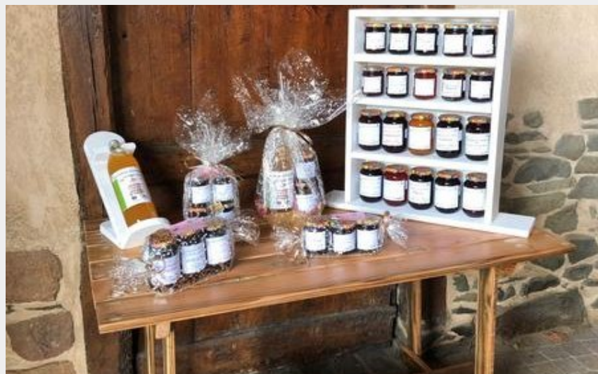
Crédit : Accueil camping-cars à la ferme_Bessenay (SCEA de Jussieu)