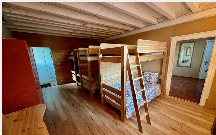
Crédit : Le dortoir australien - Lits superposés (Caroline Papegaey)