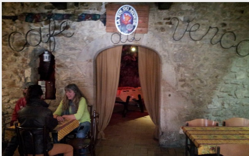
Crédit : Salle de restaurant