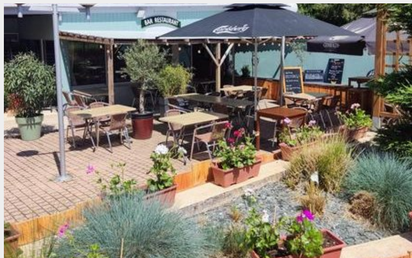
Crédit : Terrasse coté bar