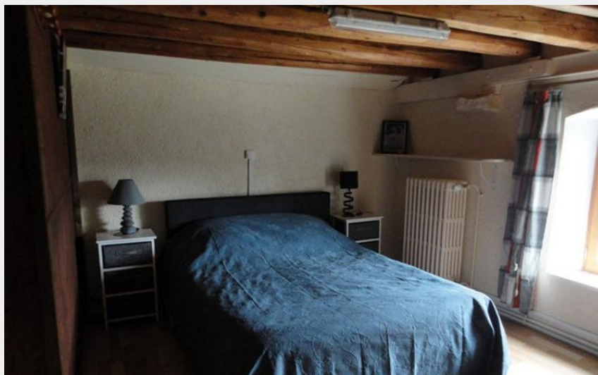
Crédit : Chambre double - Les Ecureuils