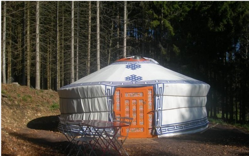
Crédit : Extérieur yourte