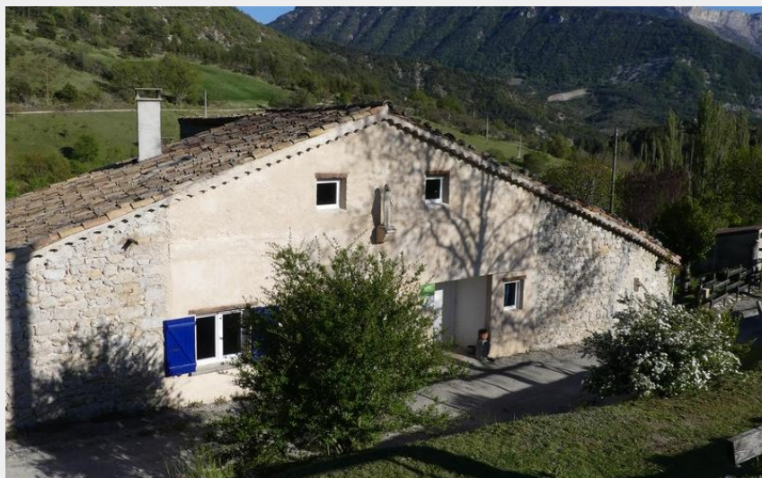
Crédit : Extérieur côté jardin