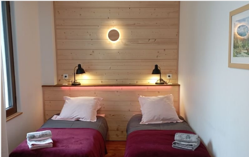
Crédit photo : Chambre double ou twin 55 (Les ateliers du Cucheron)