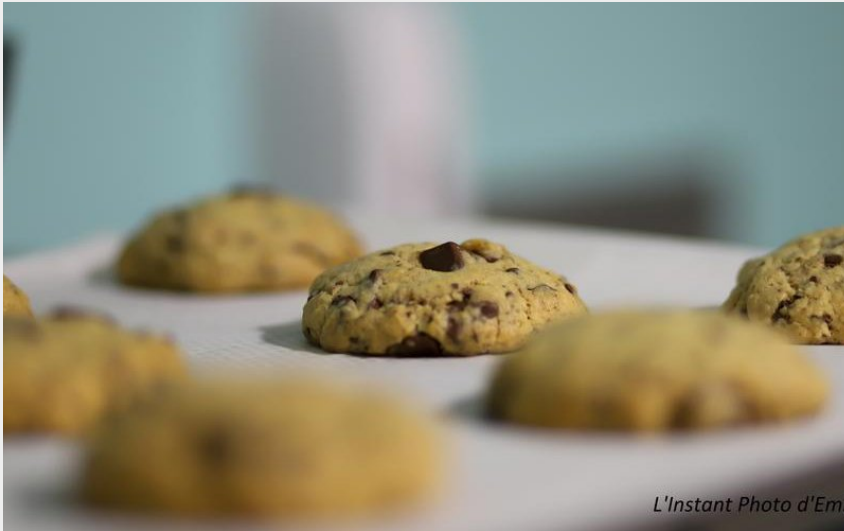
L'Instant Photo d'Emilie

Crédit photo : cookies double chocolat (L'Instant Photo d'Emilie)