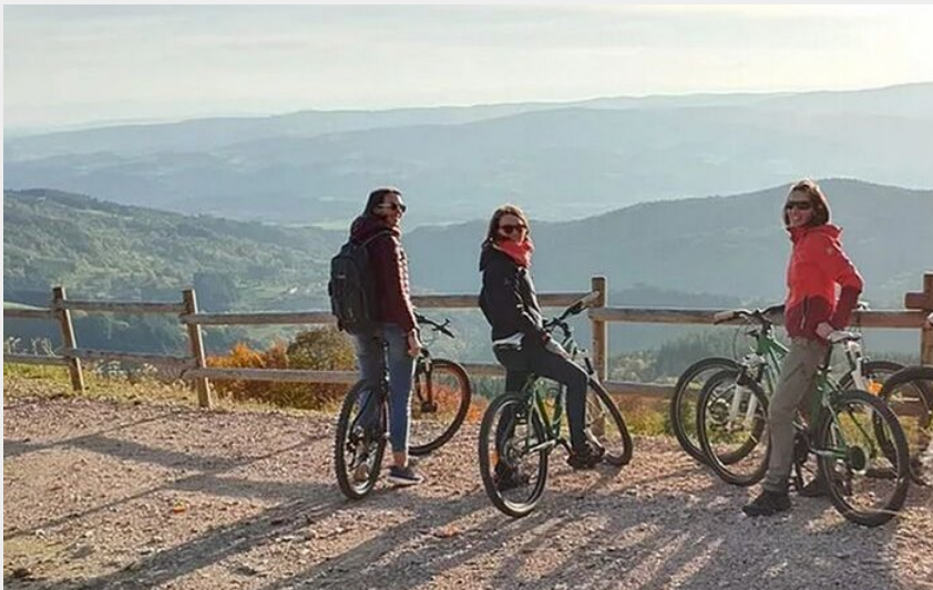
Crédit photo : Location VTT - Chalet des Gentianes (Chalet des Gentianes)