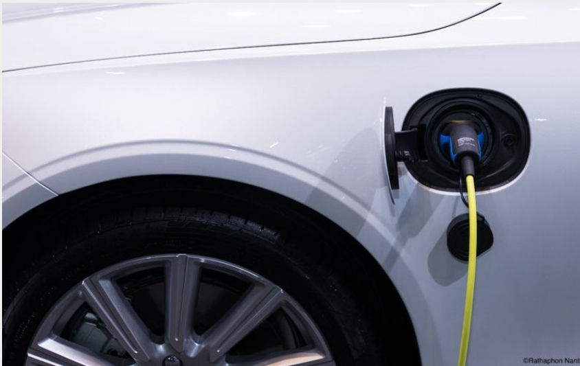
Crédit photo : Une prise est branchée sur une voiture électrique (Rathaphon Nantapreecha)