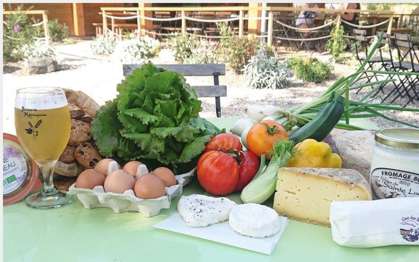
Une partie des produits bio proposés au Drive'n Bio Matheysin.