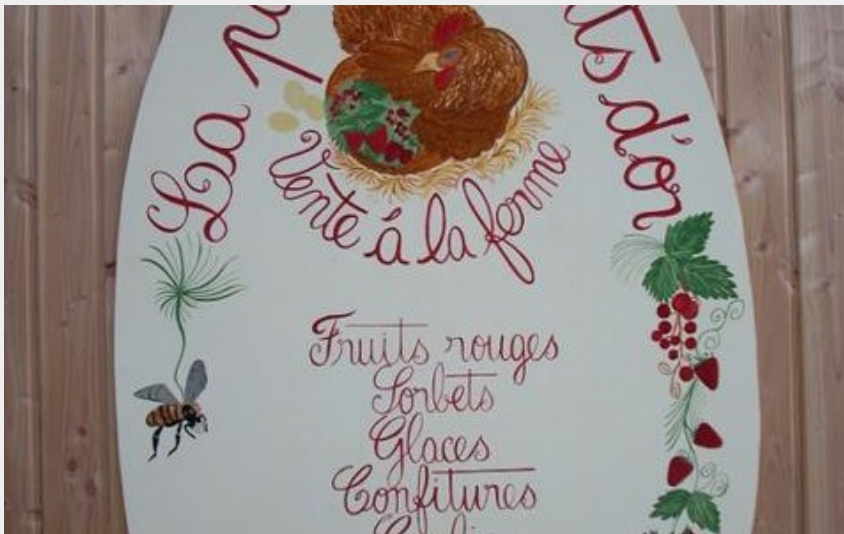
Crédit : Panneau signalant la ferme (Ferme la poule aux fruits d'or)