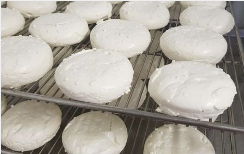
Fromages de chèvre en cours de séchage sur une grille