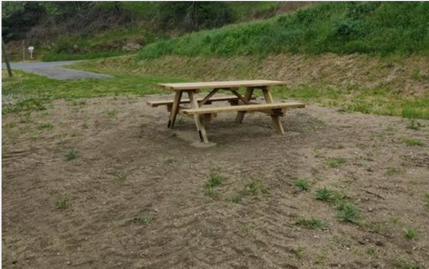
Crédit photo : Aire de pique-nique de Moulin Palais (Mairie de Bard)