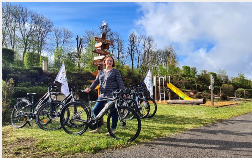
Crédit photo : Location vélo électrique 12 cols (Camping des 12 cols)