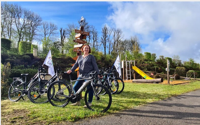
Crédit photo : Location vélo électrique 12 cols (Camping des 12 cols)