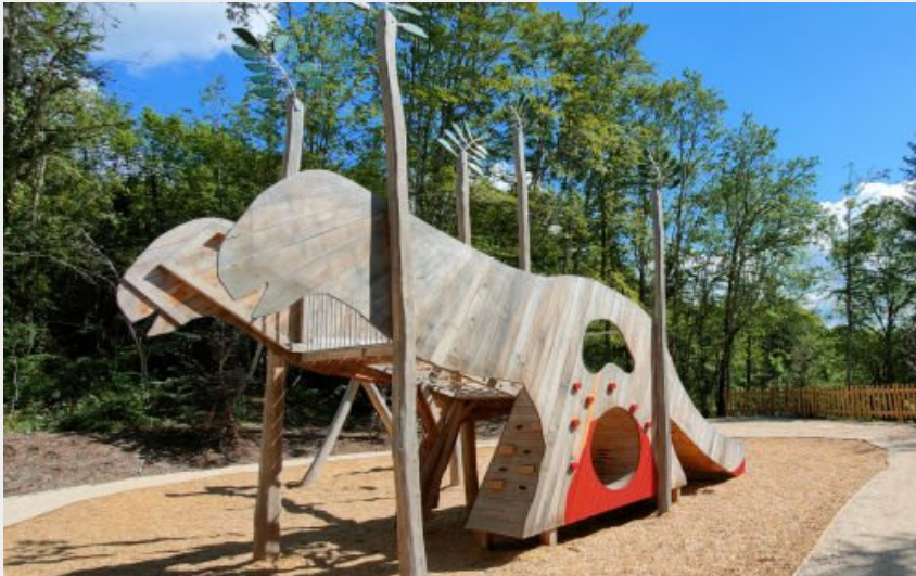
Crédit photo : Dinoplagne® : Dinoplagne® : jeu extérieur (Dinoplagne®)