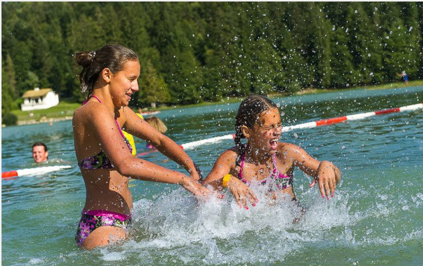
Baignade au lac Genin - Charix