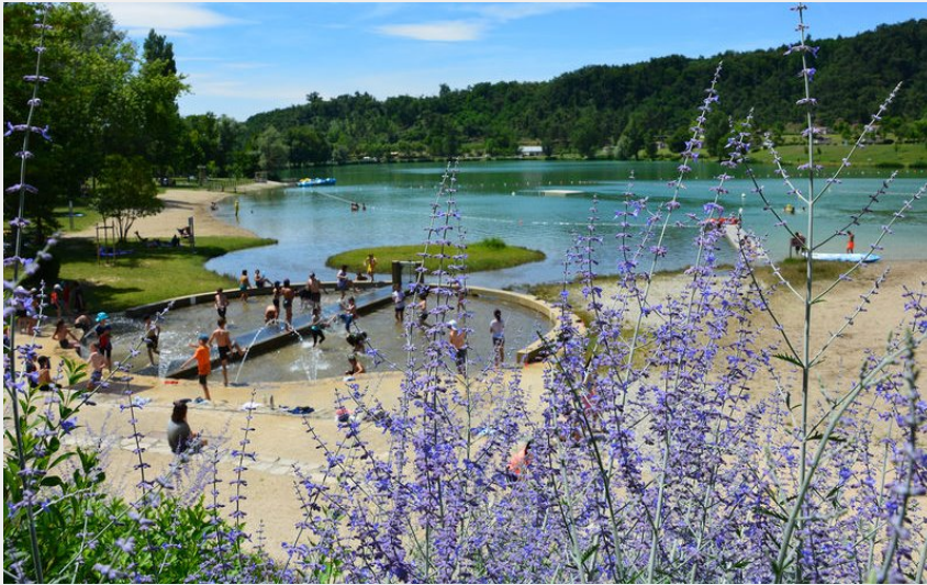
Crédit photo : Lac de Champos- St Donat (Ardèche Hermitage tourisme)