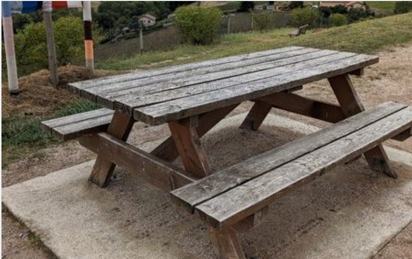
Aire de pique-nique Parc Saint Victor