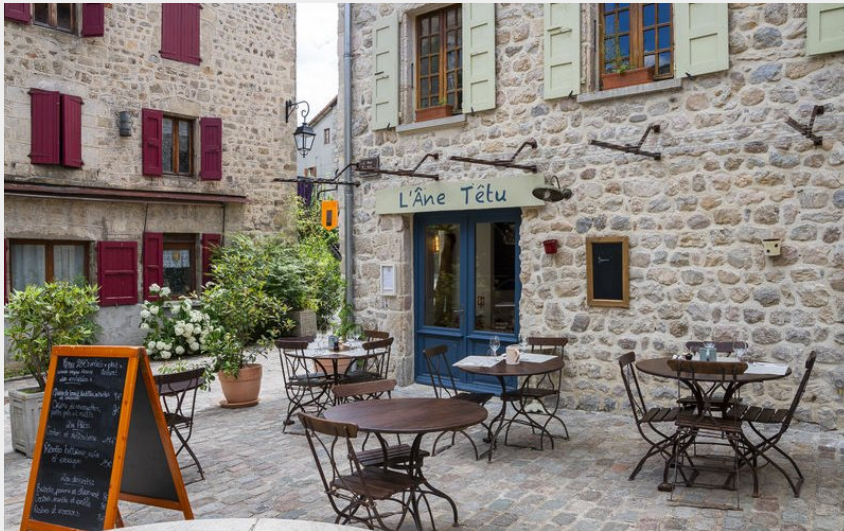
Crédit photo : La terrasse sur la place de la Fontaine (L'Âne Têtu)