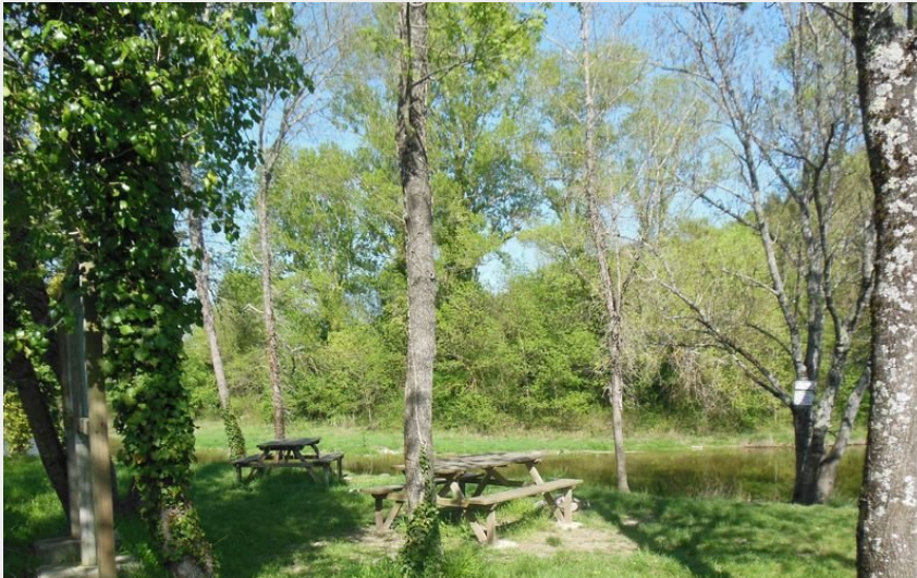
Crédit photo : Aire de pique-nique à Saint Germain (OT Berg et Coiron)