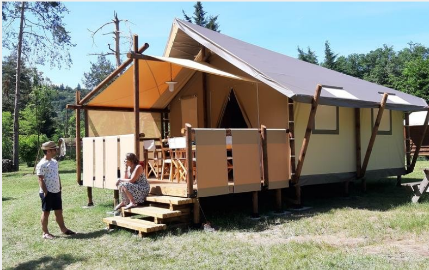
Crédit : Jungle Lodge, 5/7 personnes, Camping Le Viaduc (Camping Le Viaduc Ardeche)