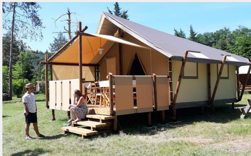
Crédit : Jungle Lodge, 5/7 personnes, Camping Le Viaduc (Camping Le Viaduc Ardeche)