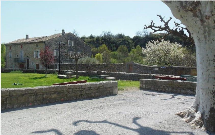
Crédit photo : Aire de pique-nique du village de St Maurice d'Ibie (OT Berg et Coiron)