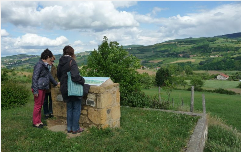
table de lecture du paysage