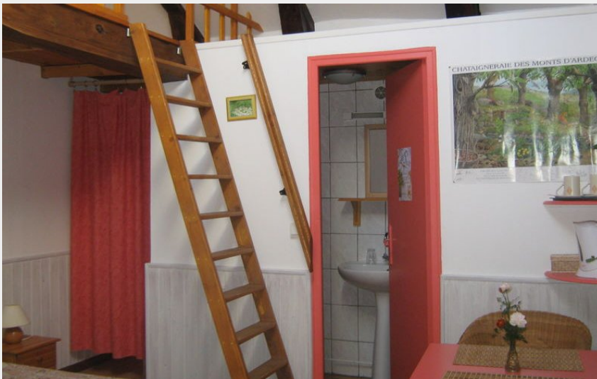
Crédit : chambre familiale sablières cevennes ardeche la ferme du fourre (s_villena)