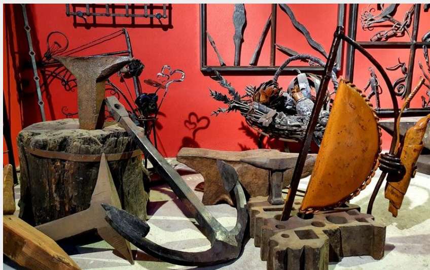
Crédit : La Mourine Maison des forgerons (Saint-Etienne Tourisme Christophe Roy)