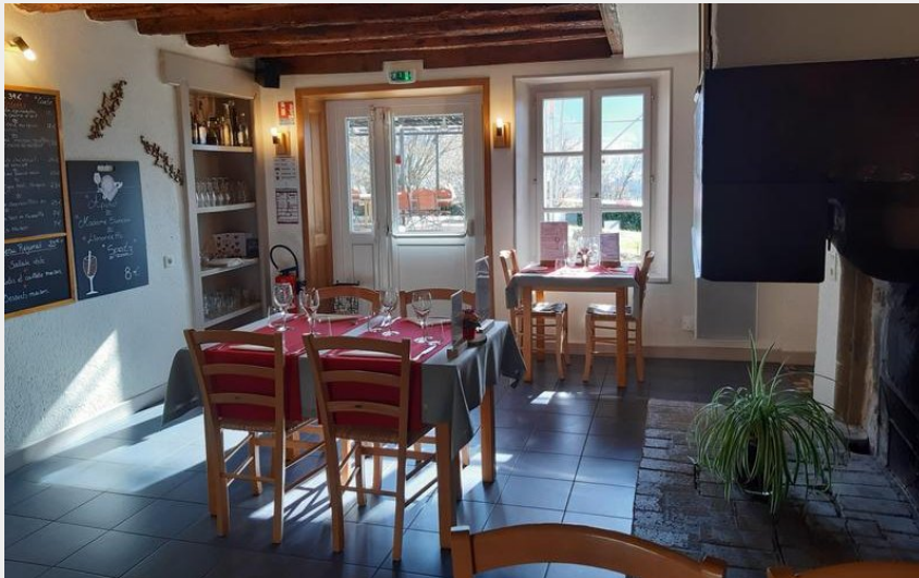
Crédit : Salle de restaurant