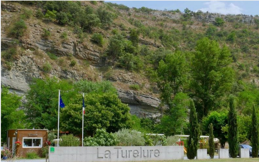
Crédit photo : Camping La Turelure à Uzer, dans le Sud de l'Ardèche (©La Turelure)