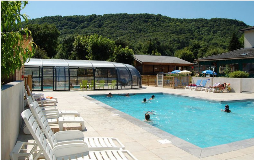
Crédit photo : Le Repos du Baladin (DR Office de tourisme du Sancy)