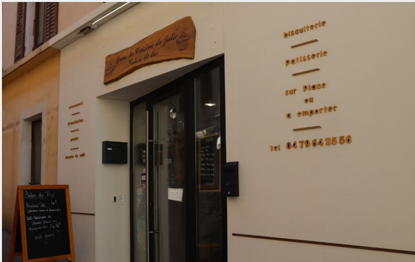
Crédit photo : Devanture Dans la Cuisine de Julie (OT Montagnicimes)